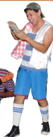
Tarde de Espiritualidade e Noite Cultural com os jovens dia 01/05