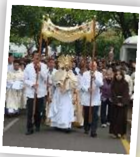
Editorial - Frei Rivaldo Página 2

Paróquia São Francisco de Assis de Umuarama (PR) Nº 014 – Junho – 2010