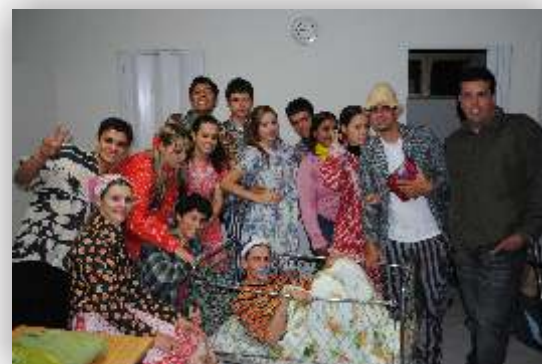
Homenagens as Mães na Matriz 17h30min