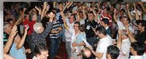
Encontro de homens 30/04 a 02/05