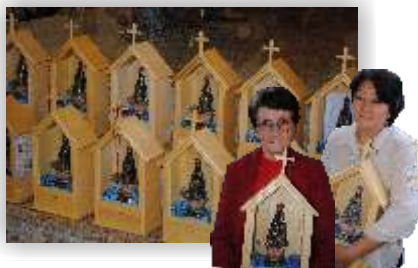
Missa com as Capelinhas 02/05